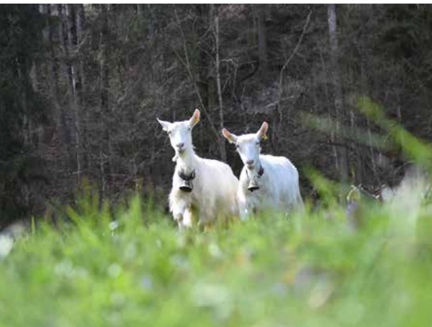
Die Appenzellerziege wurde als einzige Ziegenrasse mit dem Status kritisch eingestuft. La chèvre d'Appenzell est la seule race caprine à avoir été classée en statut critique.

Die Beitragsansätze für Schweizer Rassen mit Status kritisch und gefährdet sind in Art. 23c, Abs. 2 und 3 der Tierzuchtverordnung (TZV) festgehalten. Die nach gültiger TZV grundsätzlich beitragsberechtigten Ziegen- und Schafrassen sowie die zur Auszahlung vorgesehenen