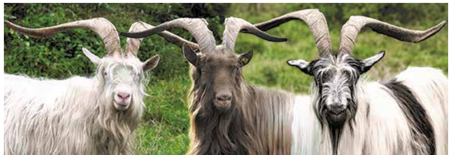
Drei weitere Schweizer Rassen vom BLW offiziell anerkannt. Das Herdebuch wird durch den SZZV geführt. Trois nouvelles races de chèvres officiellement reconnues par l'OFAG. Le herd-book est désormais géré par la FSEC.

Alle Züchterinnen und Züchter sind angehalten nur rassenrein, also kupfer auf kupfer, grünocht auf grünocht respektive weiss auf weiss zu züchten. Ergibt eine solche Paarung ein andersfarbiges Tier, wird dieses als rasserein geführt, erhält aber anlässlich der Exterieurbeurteilung