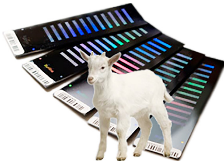
Abbildung 5: SNP-Chip. Illustration 5: Puce à ADN.

Une autre différence essentielle en regard du système actuel est le fait que la FSEC peut dès aujourd'hui disposer des données des examens. Dans l'ancien système, seul le résultat «ascendance acceptée / rejetée» était enregistré et communiqué à l'éleveur. Avec le nouveau système, la communication à l'éleveur demeure la même, cependant les 60 000 génotypes de chaque chèvre examinée sont sauvegardés et peuvent dès lors servir à d'autres applications. La première application tangible pour l'éleveur est la recherche automatique de parents éventuels, par exemple lorsque l'ascendance indiquée est refusée. La typisation de près de 60 000 SNP autorise donc l'identification de pa-