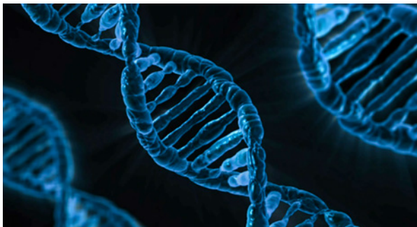
Illustration 3: Double-hélice du matériel génétique